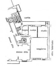
Via Messene (giardino C. Colombo)